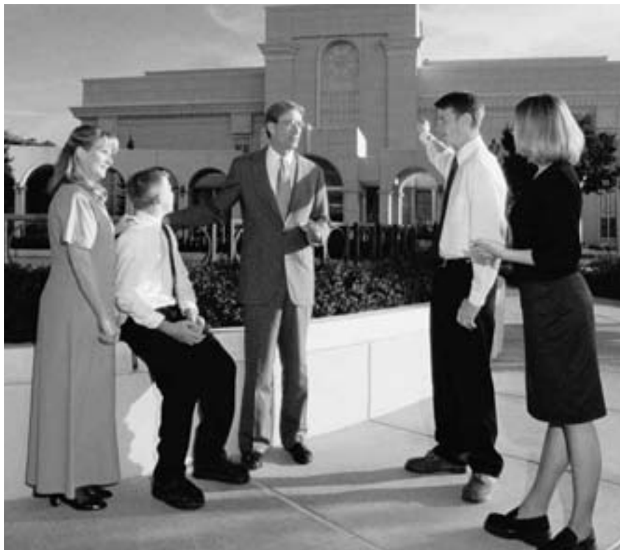
Yksi tärkeimmistä tehtävistämme on auttaa nuoria miehiä ja naisia oppimaan henkilökohtaisen esimerkkimme avulla, mitä on vanhurskas avioliitto, ja valmistautumaan siihen.