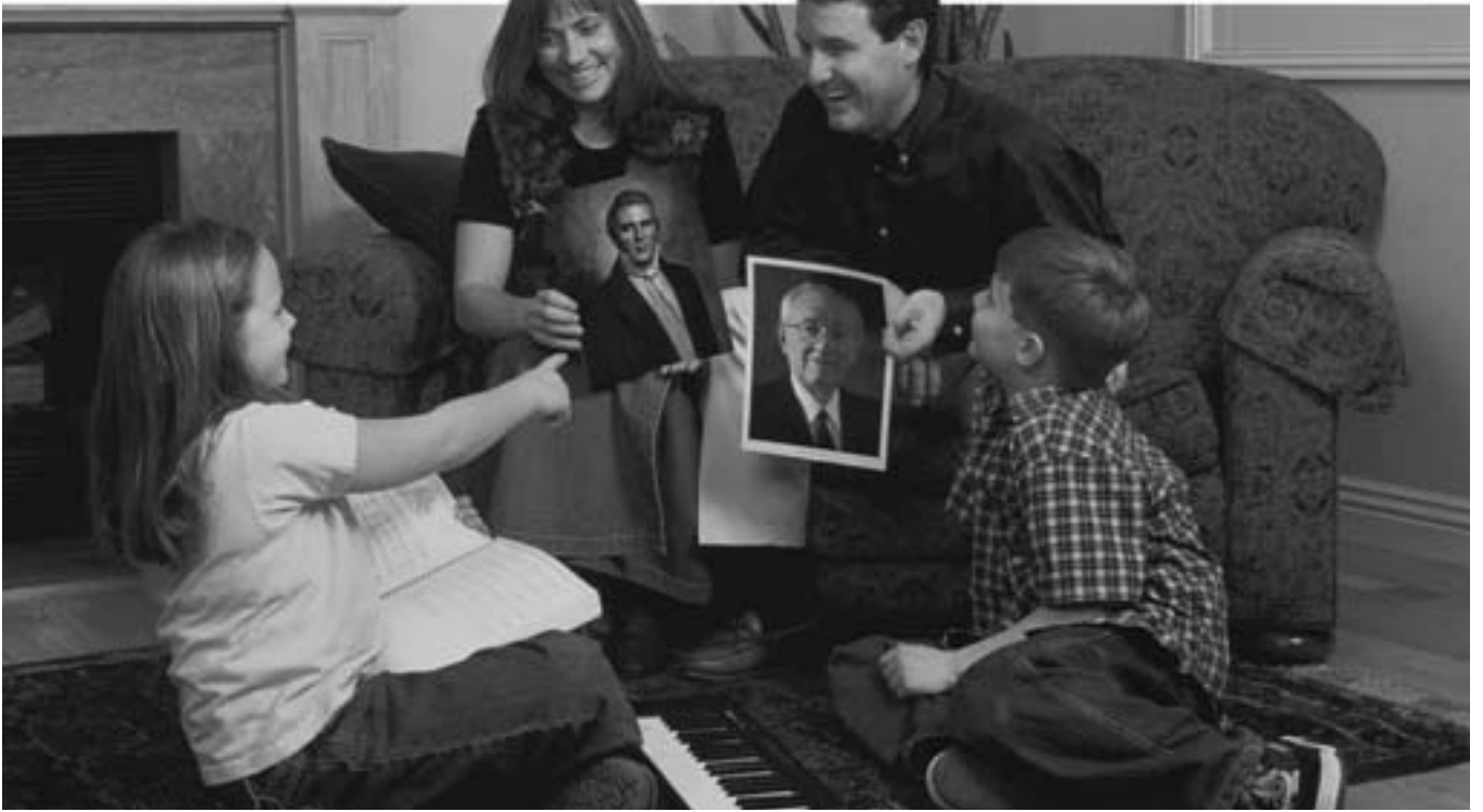
Tärkein opetus, mitä lapset tulevat koskaan saamaan, heidän tulee saada vanhemmiltaan.