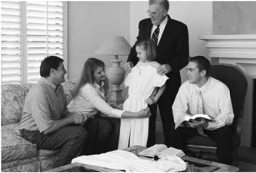
Johtajat tukevat vanhempia kunnioittamalla heitä, eivät ottamalla heidän paikkansa lapsen elämässä.

että he tarvitsevat loistavan uran, järjestöjä, joihin kuulua, ja jos heillä on varaa, niin lapsia. Äidin kunnioitettu rooli on yhä epämuodikkaampi. Haluan tehdä sen selväksi: Me emme saa antaa maailman vaarantaa sitä, minkä tiedämme saaneemme jumalallisen suunnitelman myötä.