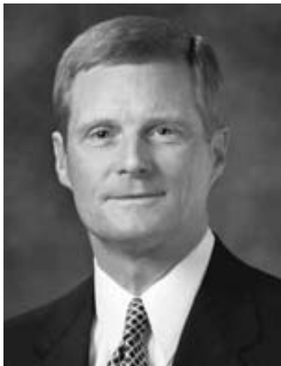
VANHIN DAVID A. BEDNAR kahdentoista apostolin koorumista