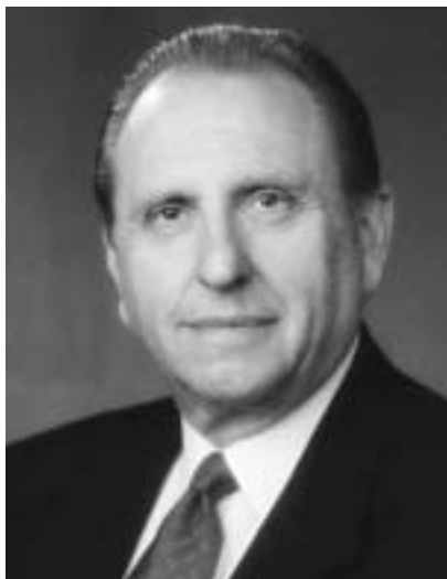
PRESIDENTTI THOMAS S. MONSON ensimmäinen neuvonantaja ensimmäisessä presidenttikunnassa