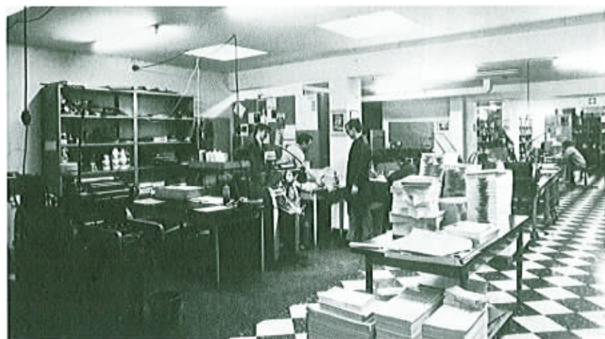
Taällä painetaan kaikki Suomen lähetyskentällä käytettävä kirkon kirjallisuus.