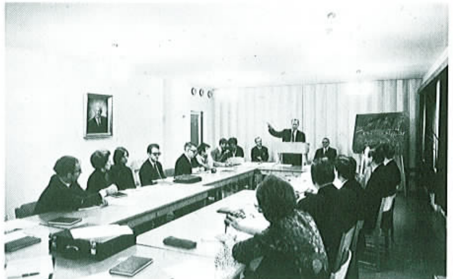
Presidentti Nelson selostamassa uutta ohjelmaa.