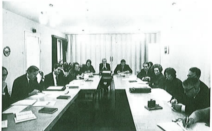
Piiriinjohtajia ja apujärjestöjen johtajia keskittyneinä kuuntelemaan.