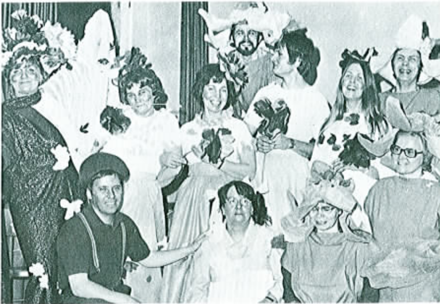
Vappuna Pohjois-Helsingin NVK:n johtajat päättivät ilahduttaa NVK-laisia harjoittelemalla ja esittämällä satunäytelmän. Kuvamme esittää onnellisia esiintyjiä erittäin opettavaisen näytelmän päätyttyä.