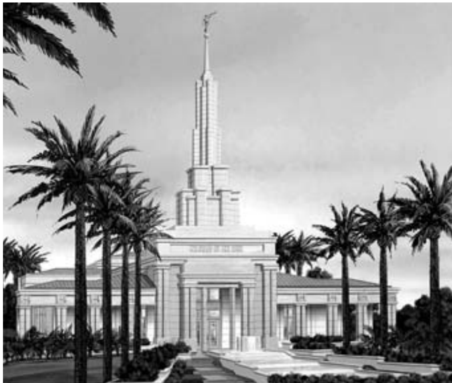
Apian temppele Samoassa

Presidentti Hinckley antoi erityisen siunauksen nuorille, niin että temppele voisi olla tärkeä osa heidän elämäänsä. ”Tulkoot tämän temppelepiirin nuoret paikalle riemuiten suurenmoisesta mahdollisuudesta palvella kuolleiden puolesta”, hän sanoi. ”Kehittäköön tämä palvelutyö heidän sisimmässään todistusta tästä Sinun suuresta myöhempien aikojen työstäsi ja vahvistakoon se heitä vastustajan juonia ja maailman houkutusiksi vastaan. Kasvakoon heidän uskonsa ja todistuksensa ja rakkautensa Sinua ja Sinun Poikaasi kohtaan.”