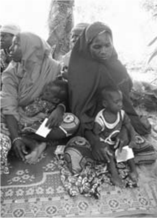
Nigerialaisia äitejä lapset sylissä odottamassa Atmitin saamista.

lähettämällä kaikkien aikojen suurimman erän Atmitia. Kirkko toimitti 36 tonnia tätä erityisesti vakavasta aliravitsemuksesta kärsiville valmistettua puuroa. Puuroa on sittemmin toimitettu paikalle lisää, ja näin tullaan tekemään jatkossakin tarpeen mukaan.