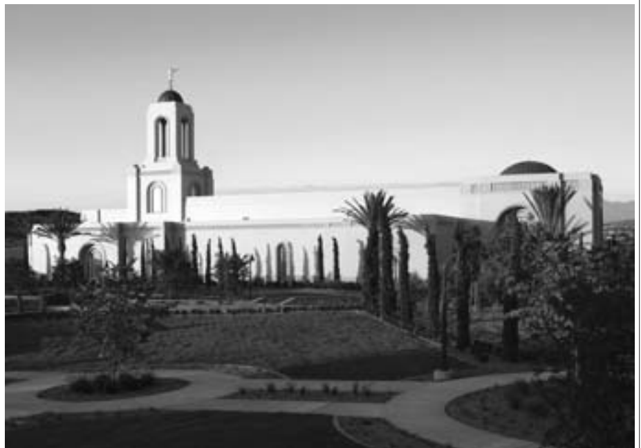
Newport Beachin temppeli Kaliforniassa Yhdysvalloissa

”Siunaa tätä maata niin, että se voi kohota voimassa ja vapaudessa Afrikan kansojen keskuudessa. Siunaa sen johtajia niin, että he