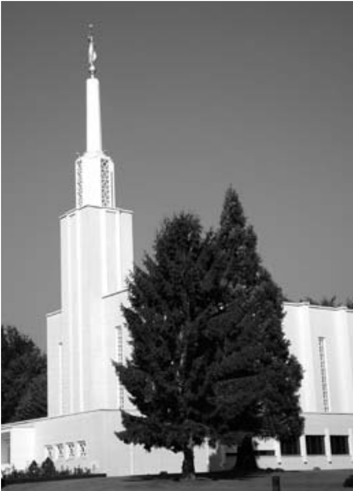
Syyskuun 7. päivänä 2005 asennettu enkeli Moronin patsas koristaa Bernin temppelein tornia. Itse temppele vihittiin noin 50 vuotta aikaisemmin.

tuokiossa hän soitti tälle miehelle. Hän huusi huoneen poikki meille, että kyseinen mies halusi tietää, asuimmeko Salt Lake Cityssä Utahissa. Kerroin asian olevan näin, ja hän vastasi: ”No, hän on tavannut teidät aikaisemminkin.” Sitten muistutin, että olin tavannut kyseisen miehen kaksikymmentäviisi vuotta sitten hänen matkustaessaan Salt Lake Cityn kautta.