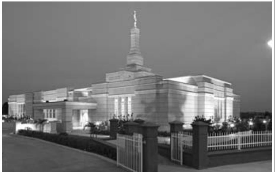
Aban temppeli Nigeriassa

Hän rukoili, että pyhää rakennusta varjeltaisiin ja kunnioitettaisiin. ”Kaikki, jotka sitä katsovat, tehkööt niin hartaasti ja kunnioittaen. Älköön mikään epäpyhä käsi sitä turmelkollaan tavoin”, hän sanoi. ”Olkoon se aina pyhä niille, jotka ovat kelvollisia astumaan sen seinien sisäpuolelle. Säästä se myrskyiltä ja rajuilmoilta.”