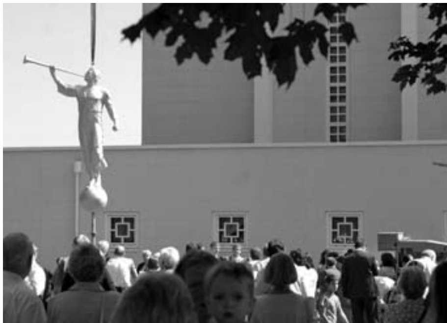
Valmistautumista enkeli Moronin patsaan asennukseen.