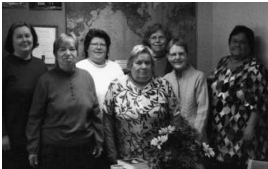
Joensuun Apuyhdistyksen sisaria

Jos ihmisellä mielessään rauha on syvä, hänen sodankin keskellä olla on hyvä. ■