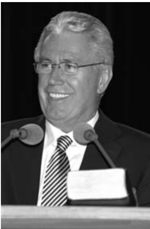
Presidentti Dieter F. Uchtdorf tapasi myöhempien aikojen pyhiä Pariisissa.

jotka osallistuivat kokoukseen Versaillesissa, että ”vaikka kahden maan välillä on käyty monia sotia, me olemme nyt ystäviä ja hyviä naapureita. Jeesuksen Kristuksen evankeliumilla on voima tehdä meistä kaikista parempia ihmisiä, eikä se erottele ketään kansallisuuden tai ihonvärin perusteella.”