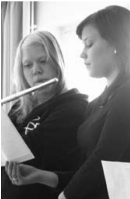
Rauman nuoret musisoimassa.

Päivä aloitettiin yhteisesti vierastalossa Jyväskylän seurakunnan nuorten naisten musiikkiesityksellä ja yhteisellä rukouksella. Aamupäivän kasteiden jälkeen nautittiin lounasta, minkä jälkeen ohjelma jatkui vierastalon