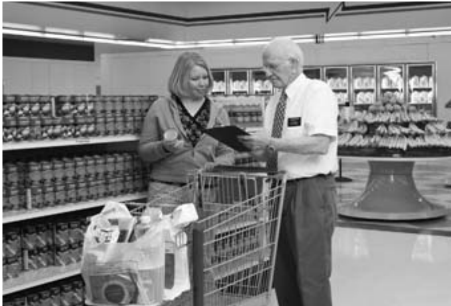
Palvelulähetysaarnaaja auttaa asiakasta piispojen varastohuoneessa Salt Lake Cityssä Utahissa.