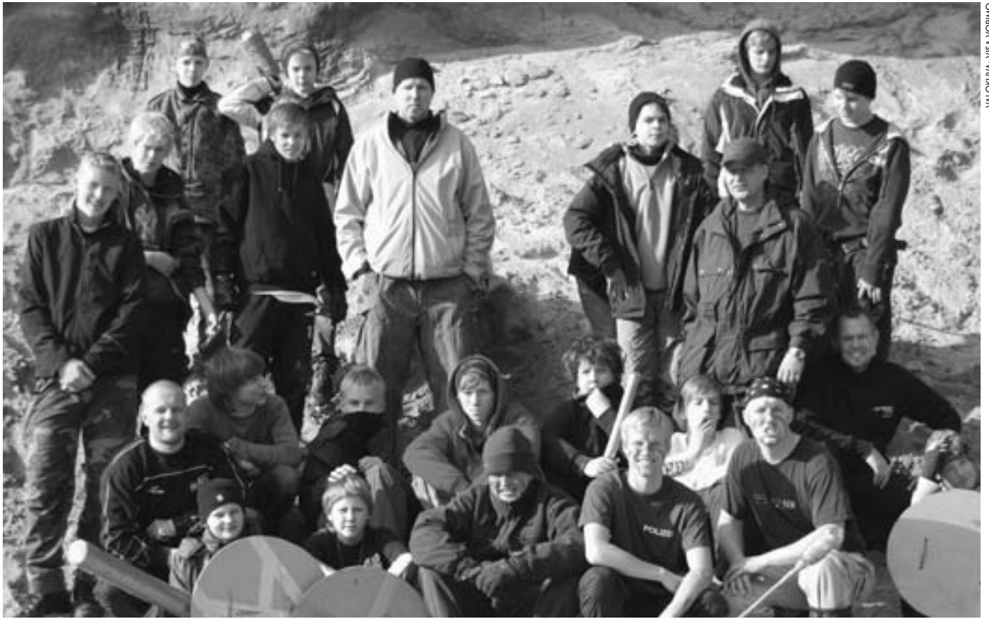
Espoon 2. seurakunnan Nuoret Miehet valmistautumassa illan koetukseen.

löytää ruokaa ja Savenvalajan valmistaa se Tulentekijän sytyttämän nuotion lämmöllä.