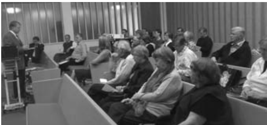
Piispa Ilpo Silvennoinen kertoo vieraille, miksi sukututkimusta tehdään.