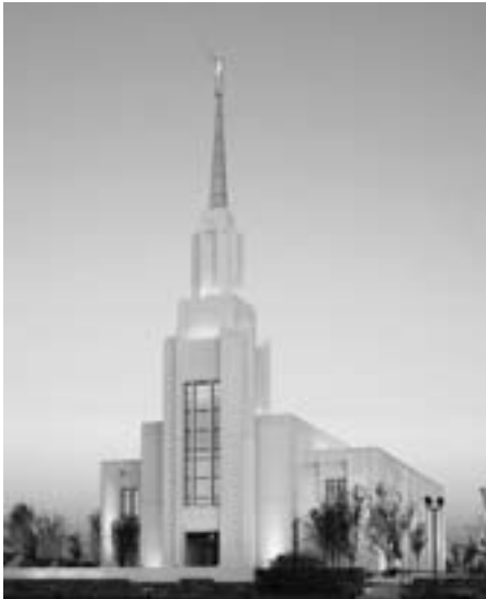
Twin Fallsin temppeli Idahossa Yhdysvalloissa vihittiin käyttöön elokuussa 2008.

Uuteen temppelepiiriin kuuluu 14 vaarnaa, ja se palvelee noin 42 000 jäsentä Etelä-Idahon keskiosissa. Tempelissäkävijät näkevät kauniin idaholaisen maiseman vesiputouksiin ja jasmikkeineen (Idahon kansalliskukka) kuvattuna 2 900 m 2 :n kokoisen temppelein seinissä, lasi-maalauksissa ja maisemoinnissa.