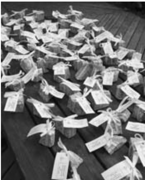
Leiriläiset saivat muistoksi palan kiveä, josta Helsingin tempeli on tehty.

ja pohtimaan kuka on ryhmänsä Peppi Pitkätossu. Ensiapurasteilla puolestaan opeteltiin ensiapua eri tilanteissa. Illalla uinnin ja saunomisen sekä päivällisen jälkeen oli hengellinen konsertti, jossa ensin saimme kuulla kauniin ja hengellisen musikaalin. Lisäksi saimme kuulla eri seurakuntien nuorten naisten musiikkiesityksiä ja syötyämme iltapalan menimme nukkumaan.