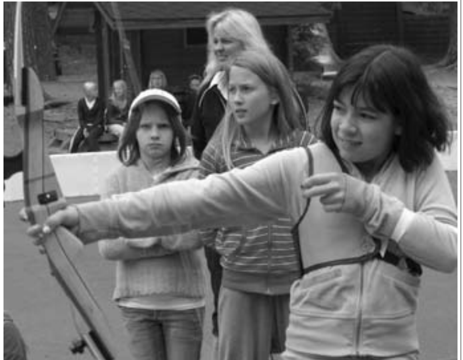
Leiriläiset harjoittelemassa jousiammuntaa.

Perjantaina eli neljäntenä päivänä nuorleirinjohtajat pitivät jälleen nuoremmille leiriläisille rasteja mm.