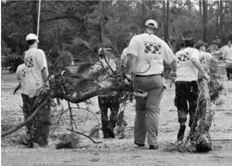
Mormonien auttavat kädet -ohjelman vapaaehtoisia Louisianassa USA:ssa auttamassa raivaamaan myrskytuhoja pyörremyrsky Katrinan jäljiltä vuonna 2005.