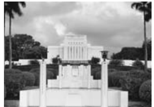
Laien temppeli Havaijissa Yhdysvalloissa