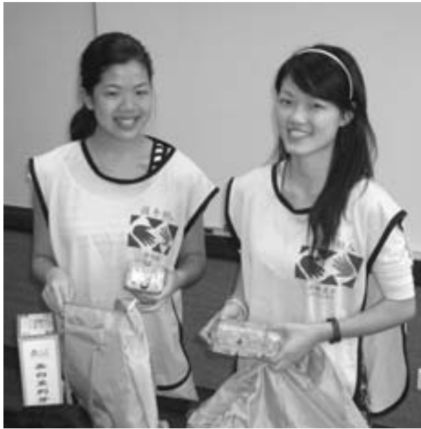
VALOKUVA NORMON BURRINGHAM

Marraskuussa 2007 yli 100 000 jäsentä Afrikassa osallistui koko maanosan kattavaan palveluprojektiin siivoamalla ympäristöään. He siivosivat ja kohensivat sodan muistoksi rakennetun Punaisen Ristin lastensairaalan ympäristöä Kapkaupungissa Etelä-Afrikassa, istuttivat yli 50 puuta Olivenhoutboschiin Etelä-Afrikassa, täyttivät kuoppia