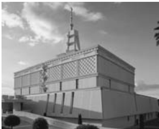
Méxicon temppeli Meksikossa

Laien temppeli Havaijissa suljettiin 29. joulukuuta 2008 peruskorjausta varten sen palauttamiseksi alkuperäiseen kauneuteensa ja vastaamaan nykyisiä temppelivaatimuksia. Peruskorjauksen odotetaan vievän noin puolitoista vuotta, ja temppeli vihittään uudelleen projektin valmistuttua.