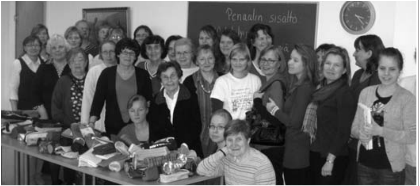
Sisarten virkistyspäivän osallistujia Tampereella.

salaatista, sämpylöistä ja jäätelöstä. Muu ohjelma oli liikunnallista, mm. hartiajumpaa.