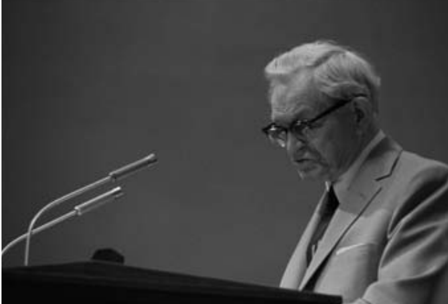
Tässä kuussa tulee kuluneeksi 50 vuotta siitä, kun presidentti David O. McKay kehotti jokaista jäsentä olemaan lähetyssaarnaaja.