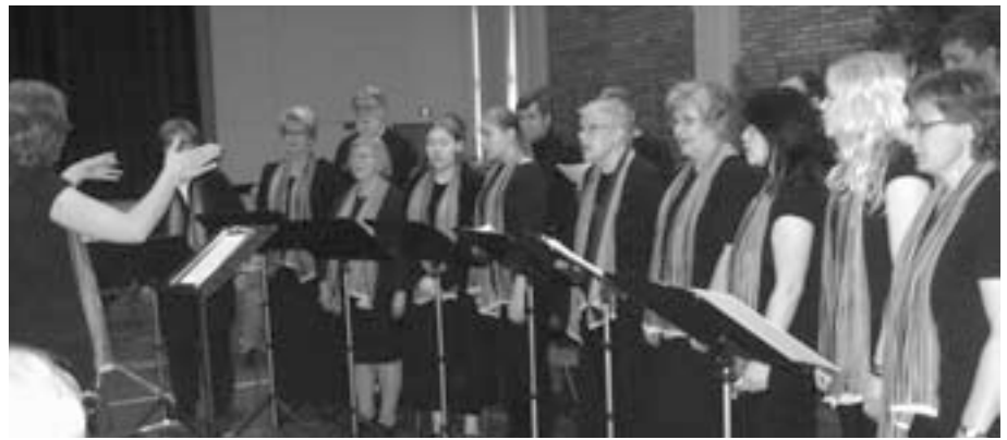
Negro spiritual -konsertista

Ihmiselämä kulki laulujen sanoissa ja sävelissä lapsuuden ajan ihmettelystä ja kyselemisestä aikuisuuden