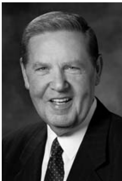
Vanhin Jeffrey R. Holland

Ainakin osa Lootin vaimon synnistä oli vanhin Hollandin mukaan paitsi sitä, että hän katsoi taakseen, myös sitä, että hän teki sen kaivaten. ”Lyhyesti sanottuna hänen kiintymyksensä menneeseen oli voimakkaampi kuin hänen luottamuksensa tulevaisuuteen”, vanhin Holland sanoi. Hän vetosi kuulijoihinsa,