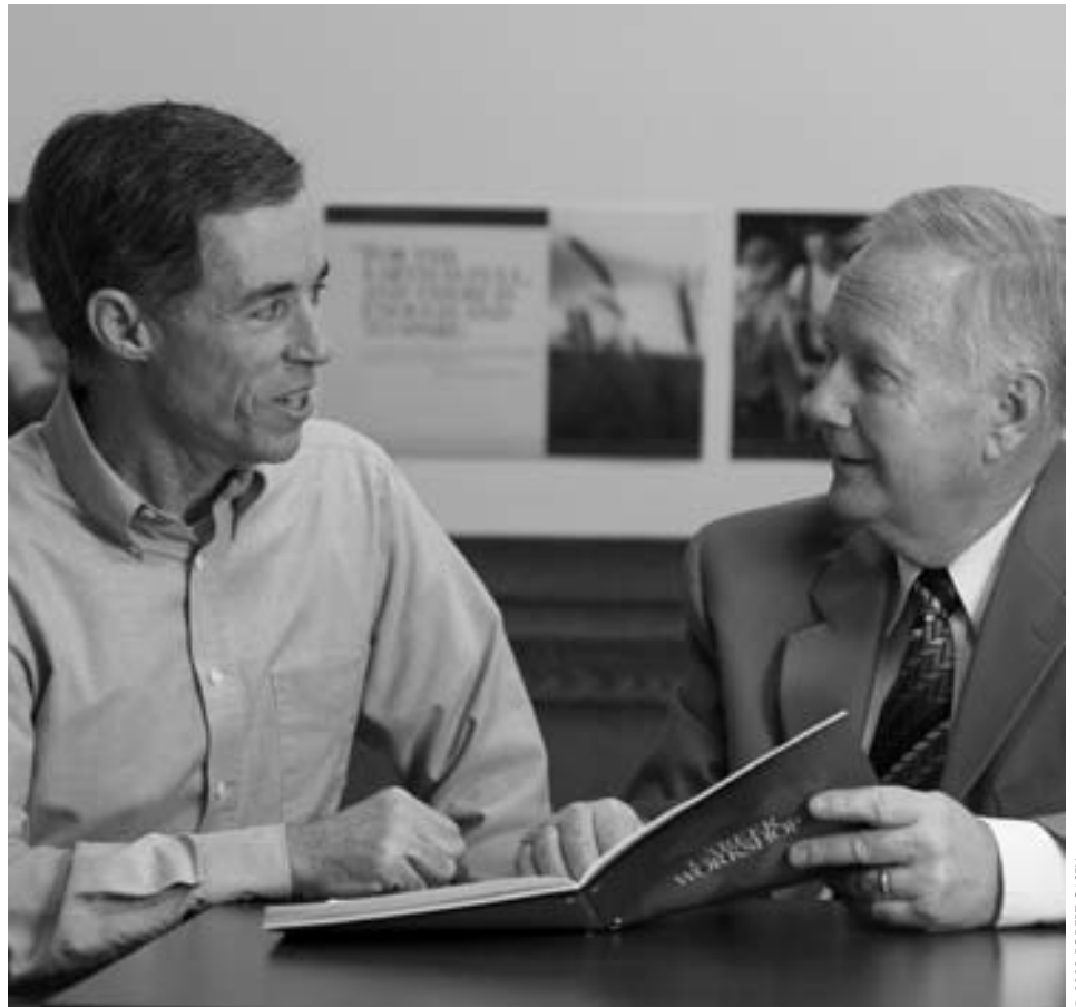
MAP-työllistämispalvelut ja sen työnhakukurssit auttavat osanottajia kehittämään tärkeitä taitoja.

Vaikka työnteko itsemme ja perheemme elättämiseksi onkin välttämätöntä, toisinaan voi olla vaikeaa saada kyllin tuottavaa työtä. Asuipa missä tahansa, työmarkkinatilanne muuttuu epävarmemmaksi ja kilpailukovenee. Presidentti Gordon B. Hinckley (1910–2008) on huomautanut: ”Olette kulkemassa kohti aikakautta, jolloin maailmassa on kilpailua enemmän kuin koskaan ennen.