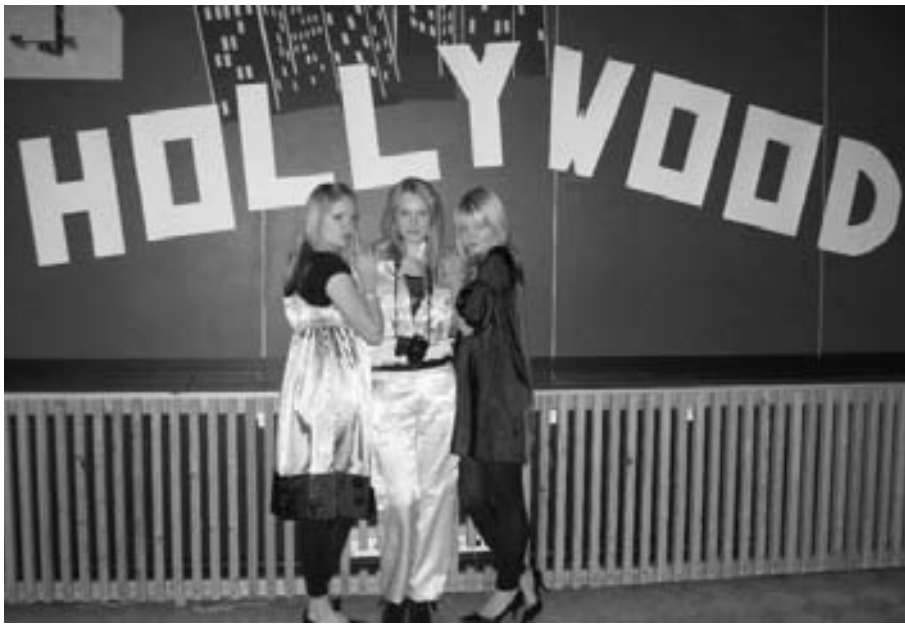
Koristelut olivat teeman mukaiset.