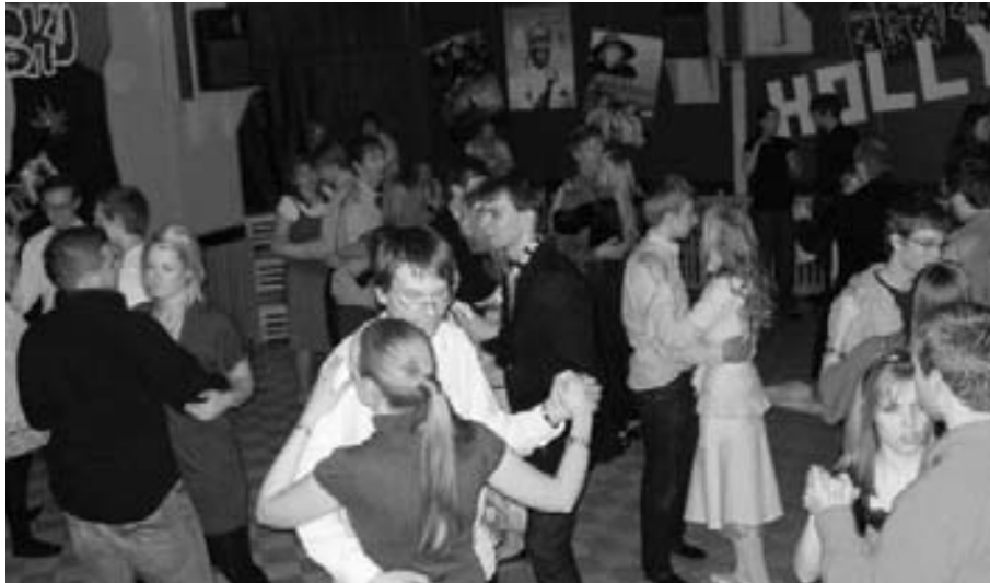
Lauantai-illan tanssiaisten huumaa.

on taas järjestetty vuosittain. Ja vieläki Oulussa, ehattomasti.