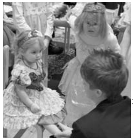
Prinsessa sovittamassa kenkää päästäkseen naimisiin Ruotsin prinssin kanssa.

Juhla alkoi esittelyllä. Kukin vieras saapui linnaan torven soidessa ja hoviherran esittelyn kera. Prinsessoja ja prinssijä saapui Espanjasta, Ruotsista, Ihmemaasta, Mettälästä, Hevosmaasta. Vieraat kulkivat punaista mattoa pitkin tervehtimään kuningasparia, jonka jälkeen sai istua juhlapöydän ääreen. Kun kaikki vieraat olivat saapuneet,