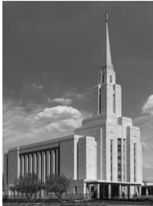
Oquirrh Mountainin temppeli Utahissa Yhdysvalloissa

Oquirrh Mountainin temppeli Utahissa on toinen Suolajärven laaksossa vihittävä temppeli tänä vuonna. Näin pyritään lieventämään alueen väestönkasvun aiheuttamaa kävijöiden ruuhkaa.