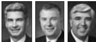
GÉRALD CAUSSE ENSIMMÄINEN NEUVONANTAJA