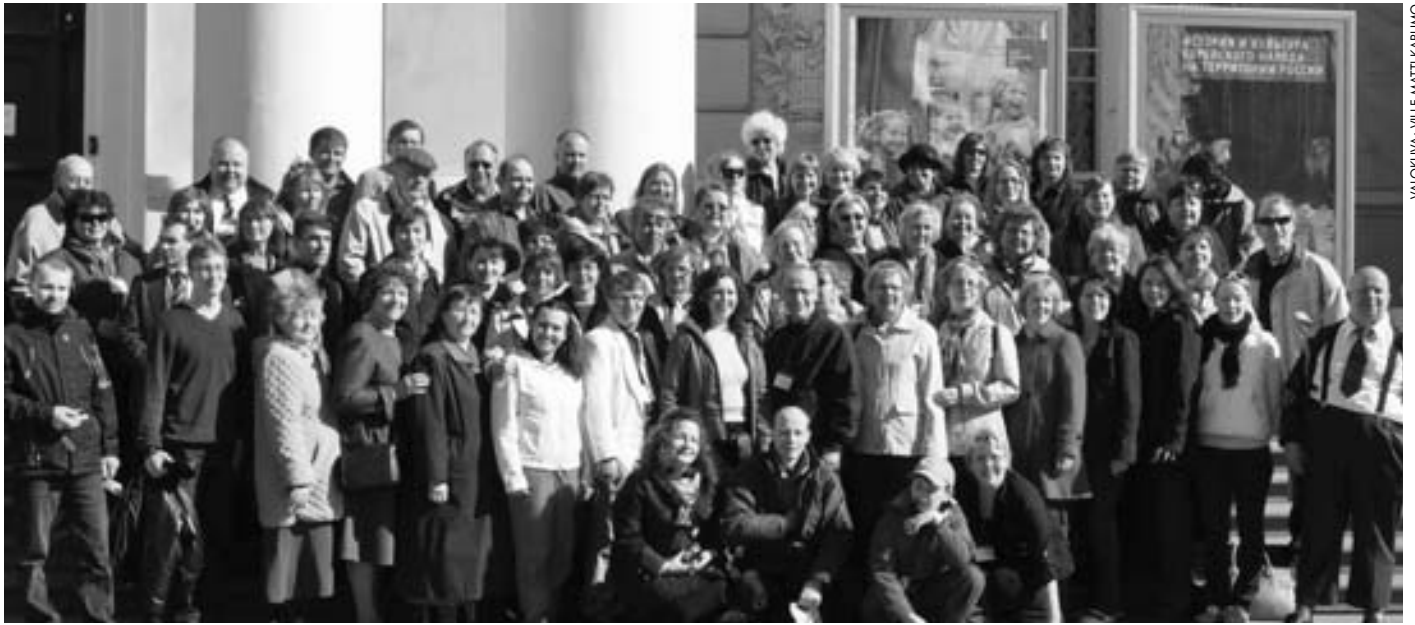
Konferenssin osallistujia ryhmäkuvassa museon portailla.

raisuutta. Kaikki otettiin innolla mukaan ja isäntäväki piti huolta, että jokainen pääsi osallistumaan. Me muutammat linja-auton täytteeksi mukaan otetut avioparit arvuutelimme keskenämme, montako nitropakkausta tarvittaisiin seuraavana päivänä. Niin oli ilo katossa ja vauhti jaloissa. Ja ennen kaikkea ilo loisti hiljaisempienkin ja myös varttuneempienkin ryhmäläisten kasvoilla. Tuli siinä myös mieleen, että pitäisikö avioparienkin tilaisuuteen kutsua mukaan näitä iloisia venäläisiä piristämään meitä jäyhiä ja totisia suomalaisia.