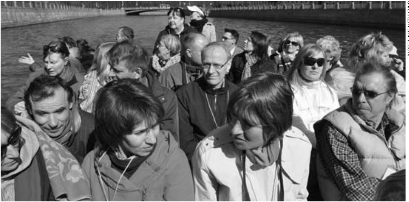
Risteilyllä Pietarin keskustan kanavilla.

majoittautuminen sujui hyvin ja jokaiselle löytyi venäläisten jäsenten avustuksella kahdesta pikkuhotellista paikka, minne saattoi päänsä muutamaksi tunniksi kallistaa.