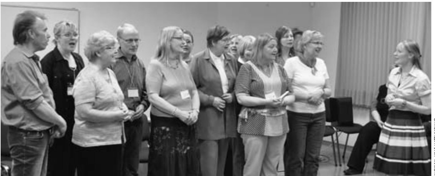
Suomalaisen illanvieton lopuksi "kuoromme" esitti musiikkinumeronsa.

Pietarin keskustan seurakuntakeskus on melko uusi ja tarkoitusta