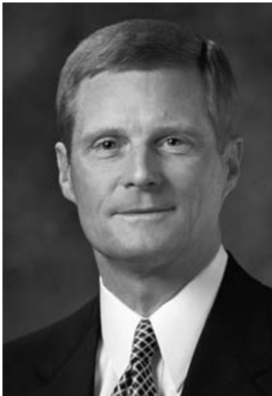
Vanhin David A. Bednar

Sellaisia vaaroja on televisiossa, musiikissa ja muuntotyypisissä medioissa, mutta ne ovat läpitu-