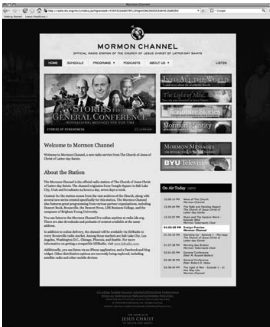
Mormon Channel, kirkon virallinen radioasema, aloitti verkossa englanninkielisenä toukokuussa 2009.

”Tulimme mukaan tähän projektiin, koska he näyttävät tekevän kaikkensa tarjotakseen laadukasta lääkehoitoa, mutta tarvitsevat yhä lisää