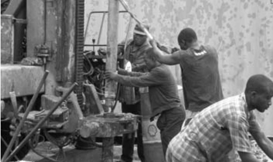
Paikalliset työntekijät poraavat raskaalla kalustolla uutta kaivoa osana kirkon ja Dikembe Mutombon säätiön yhteistyötä.