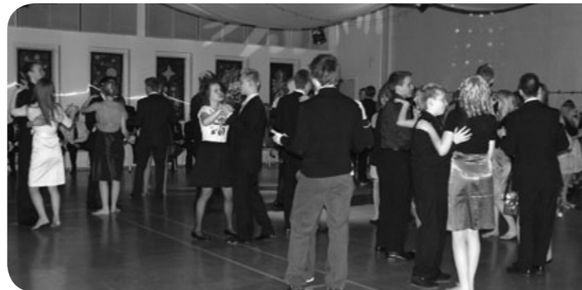
Ylinnä: Glögikin maistui