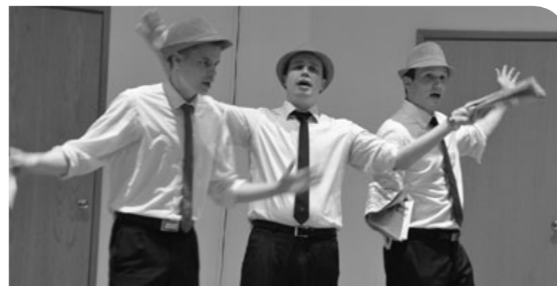
”Mä lehden luin” – toimittajat lukivat uutispätkiä 60-luvun lehdistä mm. kappelin rakentamisvaiheista.